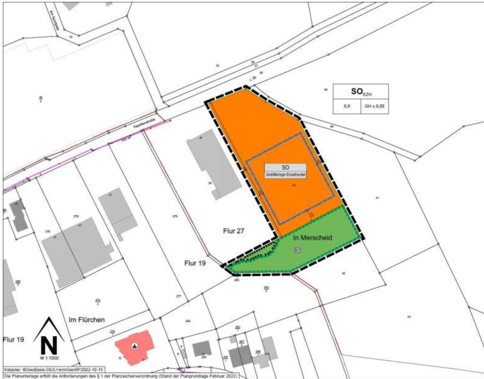
Abbildung 1: Geltungsbereich Bebauungsplanentwurf „Gewerbegebiet Kapellenstraße – 3. Änderung“