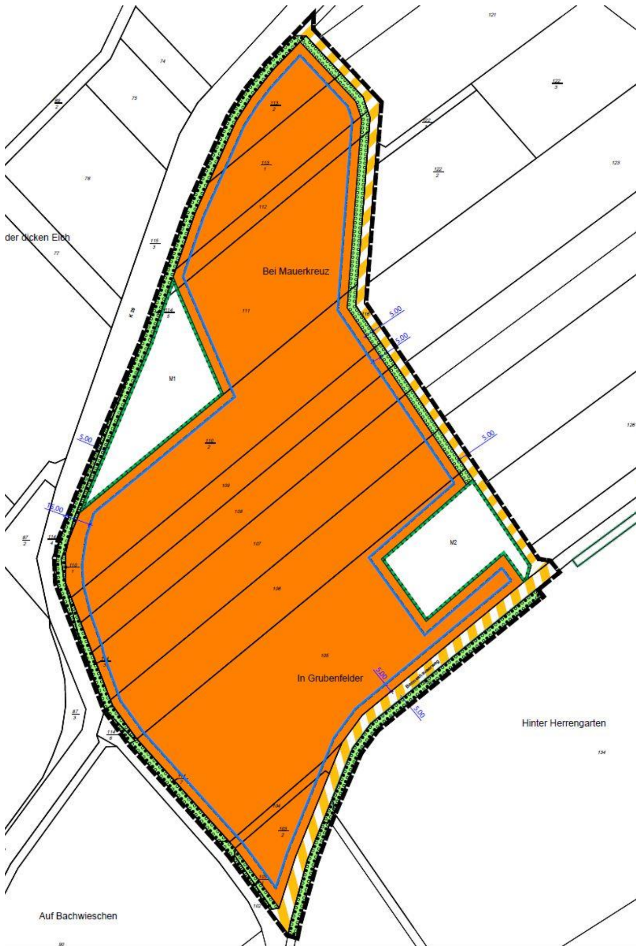
Abbildung 1: Ausschnitt B-Plan-Vorentwurf „Solarpark Bei Mauerkreuz“